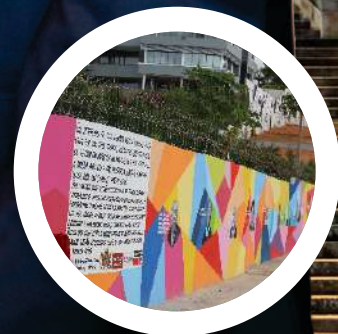
Maputo homenageia vítimas da COVID-19